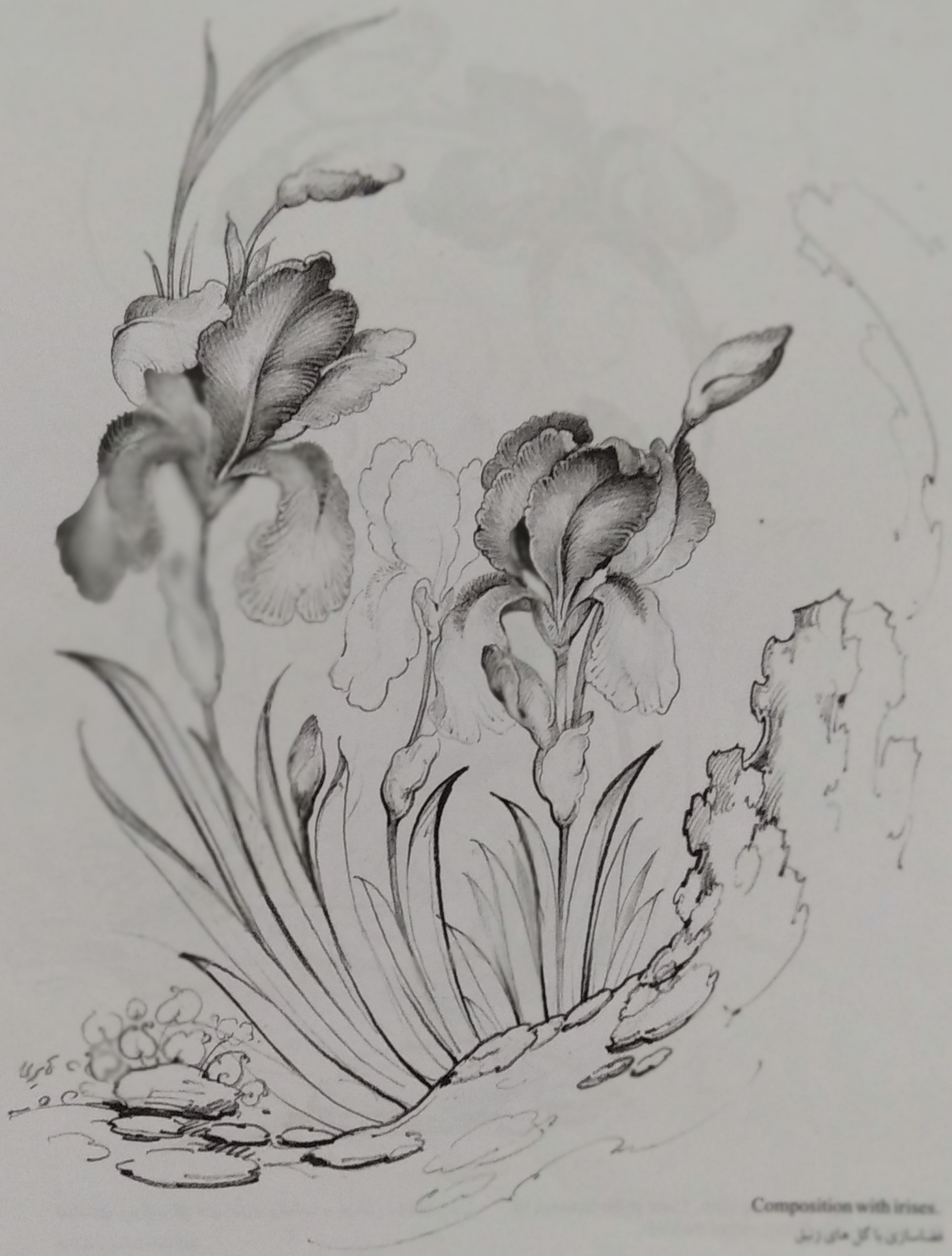
Composition with irises. تلفیق با گل های ارغوان